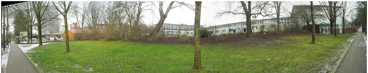
Photo 9 – ECOLE MATERNELLE M3 A DEMOLIR